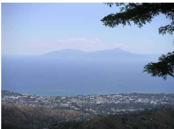
海に面した首都ディリの街